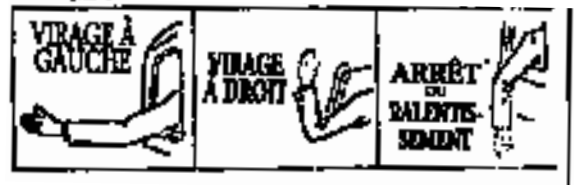
N° 1 N° 2 N° 3

(2) Notwithstanding subsection (1) the operator may indicate his intention to