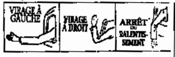
N° 1 N° 2 N° 3

(2) Notwithstanding subsection (1) the operator may indicate his intention to