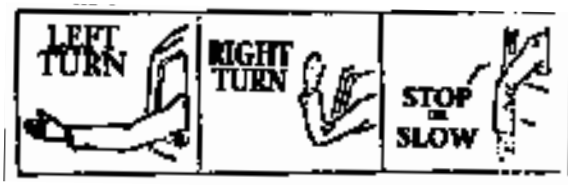
No. 1 No. 2 No. 3