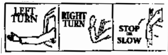
No. 1 No. 2 No. 3